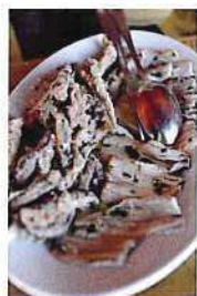
アドリア海の 海の幸も いただきます!