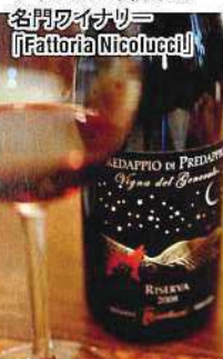
サンジョベーゼ100%の ワインを造り続ける 名門ワイナリー