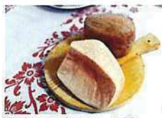
縦穴の洞窟でチーズを 熟成するフォッサ・チーズ。 魅惑の香りと、 旨味が調和する。 「Fossa Pellegrini」