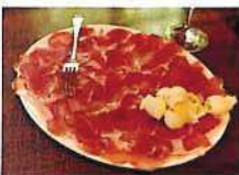
ジベッコの 「Trattoria La Buca」の 名物クラテッロ