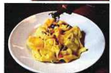
バルサミコとランブルスコを生産する 「Azienda Agricola Pedroni」では 本物を味わう。ジュゼッペ25年(左)、 イタロ12年(右)のアチェートバルサミコ酢。 かけ過ぎ注意。ほどよくかけることで味に深みが出る