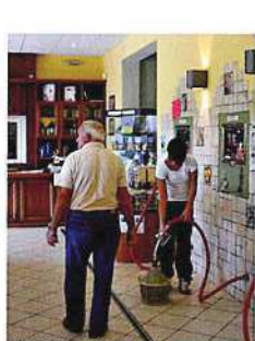
ブリジゲッラにある 農産物協同組合の店内。 地元の人々はワインもオイルも こんな風を買っていく。 これがいちばんうまい!