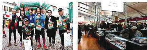
完走後の達成感は快感に!