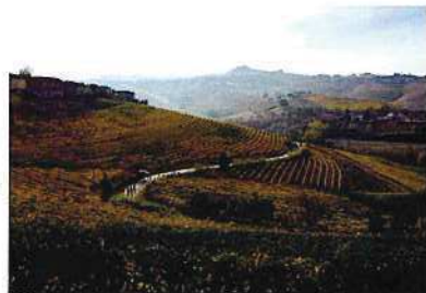
ブドウ畑の中を走り、登りきった時に開ける絶景